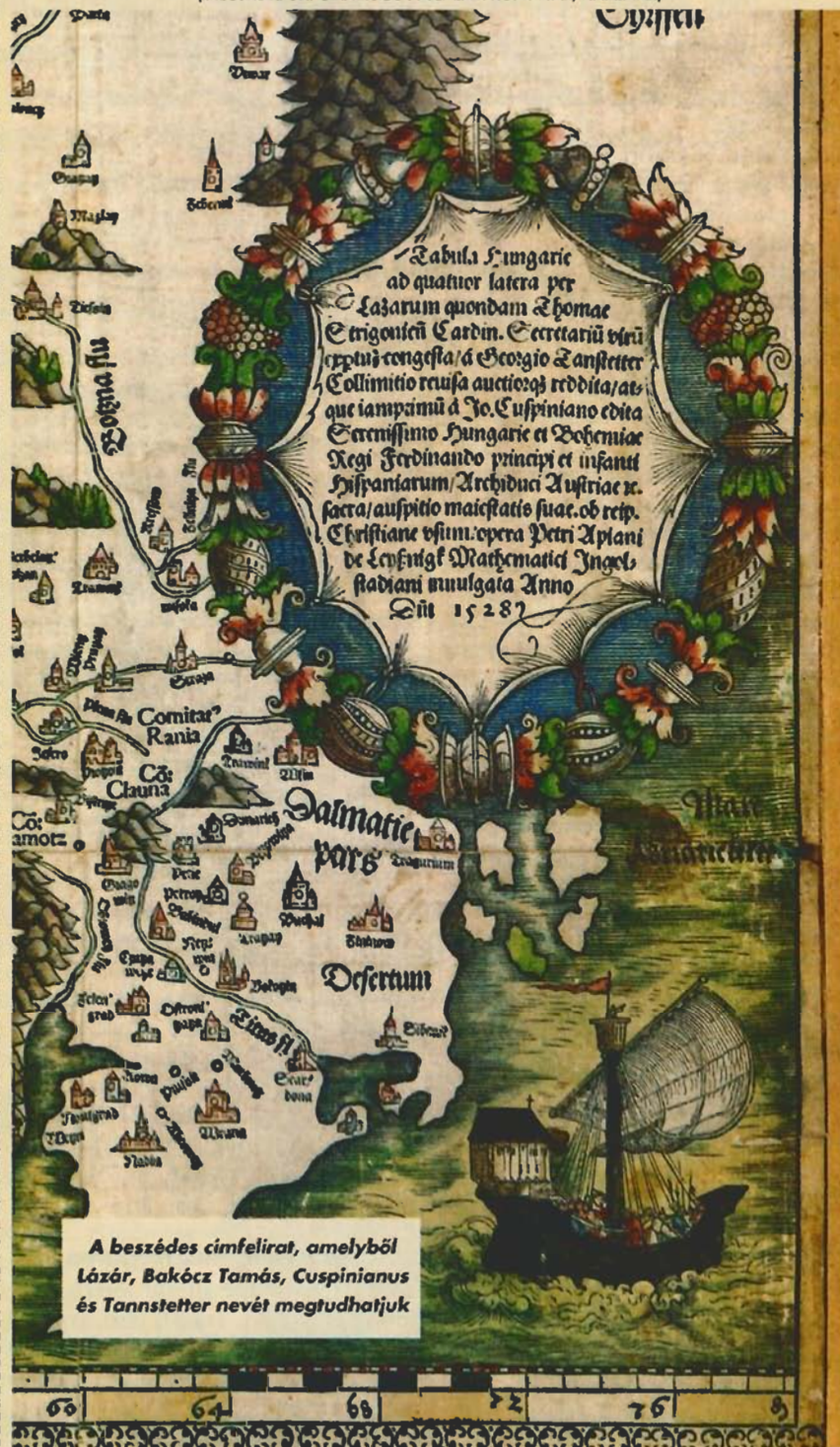
A beszédes címfelirat, amelyből Lázár, Bakócz Tamás, Cuspinianus és Tannstetter nevét megtudhatjuk