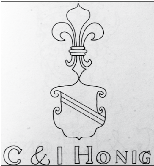
2. ábra Vízjel

ezért a térképek első fogalmazványaihoz az olcsó, leggyengébb minőségű papírt használta, sokszor olyat, amelynek egyik oldalát már felhasználta, míg a hivatalos megrendelésre készült, sárga-fekete keretes térképek jobb minőségű papírra készültek. A pécsi térkép is finom minőségű papírra készült, ugyanis alsó részén egy összetett vízjel részlete látható. Az uradalmak felsorolásától jobbra egy stilizált liliumot, ennek folytatásában egy kettős osztású ferdén vágott címerpajzsot láthatunk, Csemely és Kácsfalu között pedig egy feliratban folytatódik a vízjel. Sajnos a vízjel a liliumtól a felirat felé haladva egyre nehezebben kivehető, de ha összevetjük Bendefy Lászlónak a Mikoviny térképekre vonatkozó vízjel-gyűjtésével, akkor az alábbi vízjellel vonhatunk párhuzamot 8 (2. ábra).