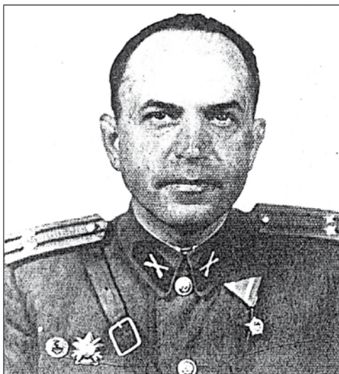
Csikor Kálmán ezredes

Tragikus sorsú szakemberre emlékezünk most. Élete tele volt viszontagságokkal, akárcsak a magyarok XX. századi történelme. Volt gazdálkodó és katonatiszt, egyetemi tanár és az 56-os forradalom hőse, koncepciós per áldozata és geodéta.