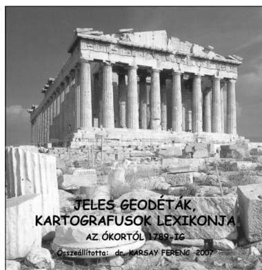
3. ábra Lexikon az ókortól a XVIII. század végéig

Az első kötettel (ez is CD) kapcsolatban elmondhatom, hogy összeállításakor a legrégebbi ókori hagyományok összegyűjtése és a legkorábbi alkotók közreadása vezérelt. Ebben szinte valamennyi, abból a korból fennmaradt szakanyag, térkép, kódex, leírás és azok szerzője szerepel. Így a lemezen olvasni lehet az egyip-