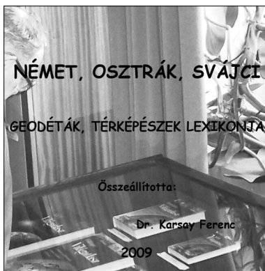
4. ábra Lexikon a német nyelvterületről