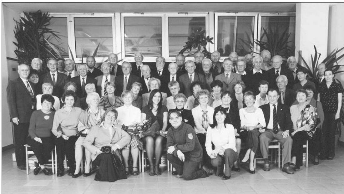
Csoportkép a jelenlévőkről

aratott. A szokásos csoportképhez is jó szívvel velünk maradt a művésznő, rajongóival külön-külön is szívesen fényképezkedett.