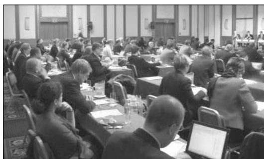
A konferencián 110-en vettek részt