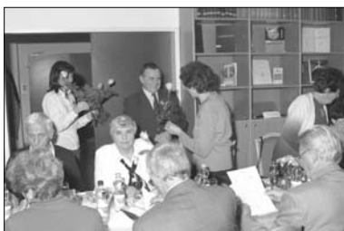
A FÖMI főigazgatója virággal köszönti a hölgyvendégeket

költözés utáni címüket, illetve senki sem értesít minket a halálesetről.