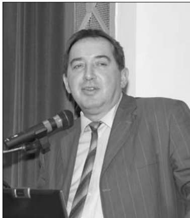
Sirman Ferenc szakállamtitkár köszönti a jelenlévőket

Sirman Ferenc szakállamtitkár köszöntőjében hangsúlyozta a földhivatali vezetők, munkatársak továbbképzésének szükségességét. Az elmúlt évtized számítástechnikai, informatikai, műszer- és adatgyűjtési technikai fejlődése új kihívásokat jelentett és alapvetően változtatta meg a földhivatalok tevékenységét, szemléletét. Ebben kívánt segítséget nyújtani a több lépcsős képzés, amit szándékaik szerint a jövőben tovább fognak folytatni