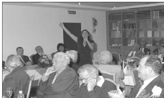
Palya Bea énekesnő csodálatos hangjával és magával ragadó stílusával elbűvölte a vendégeket

2008 novemberében Palya Beát sikerült megnyerni (a bátyja nálunk dolgozik) meglepetésül, hogy énekeljen egy kicsit nekünk. Gyönyörű, egyedi hangja, színpadra termett megjelenése, kedves egyénisége nagy sikert