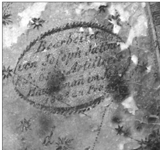
8. ábra Az armilláris széra készítője Joseph Jüttner

Érdeemes néhány szót szólni még az armilláris szféráról. A magyar szakirodalomból is ismert [9] [p.80, 104. kép] Joseph Jüttner (1775–1848) 1828-ban készített csillagászati gömbje, így feltehető, hogy az ugyanazzal a technológiával gyártott armilláris glóbusz került az Elekes-gömb köré. Mivel azonban a szakirodalomban senki nem említi a 12 cm-es földgömbbel kapcsolatban az armilláris szférát, feltételezhetjük azt is, hogy többféle „kiszerezésben”, mind egyszerű talpra helyezve, mind drágább felszereléssel (meridiángyűrű, horizontkör stb.) egyaránt forgalmazták, mint arra számos bizonyítható példát találunk a későbbi korok glóbuszforgalmazásánál.