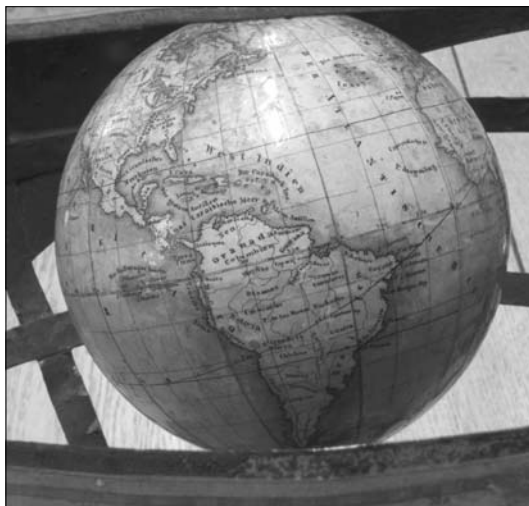
1. ábra Elekes Ferenc 12 cm átmérőjű, 1831-es bécsi kiadású glóbusza, a klosterneuburgi könyvtár gyűjteményében