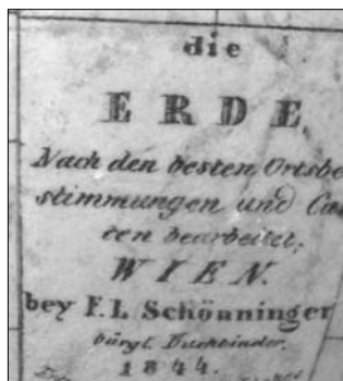
9., 10. ábra Elekes Feren 16,5 cm átmérőjű, 1844-es bécsi kiadású glóbusza és annak felirata, az Osztrák Tudományos Akadémia könyvtárában

A glóbusz egy példányát az Osztrák Tudományos Akadémia könyvtárában őrzik. Nyilvántartási felirata: ÖSTERREICHISCHE AKADEMIE DER WISSENSCHAFTEN SAMMLUNG WOLDAN GL-V(L); WE 300 , ami arra is utal, hogy a Woldan-gyűjtemény 7 darabja. Erről a gömbről is sikerült felvételeket készíteni Dombóvári Eszter , Gede Mátyás és Gercsák Gábor közreműködésével, Mag. Gerhard Holzer szíves hozzájárulásával. A fényképfelvételek – hasonlóan a klosterneuburgi glóbuszhoz – ebben az esetben is úgy készültek, hogy azok felhasználásával mód nyíljon virtuális földgömbök elkészítésére is, a Virtuális Glóbuszok Múzeuma számára.