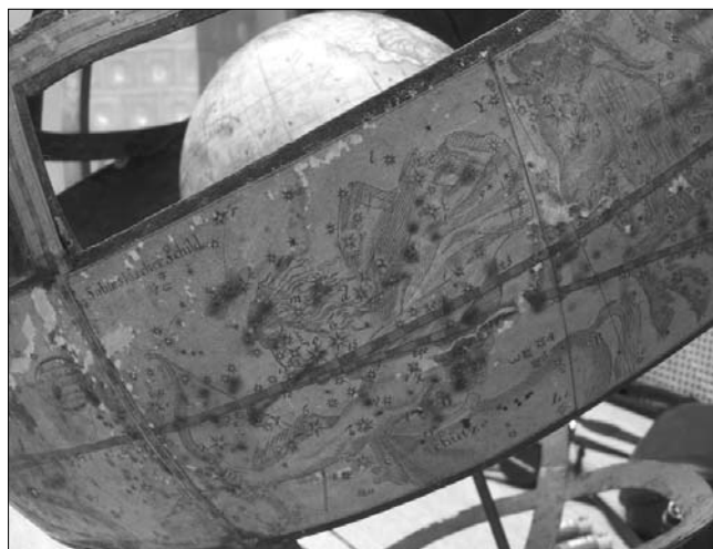
7. ábra A Nyilas (Schütze) csillagkép