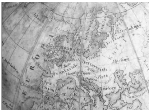
3. ábra Ferrótól a Fekete-tengerig