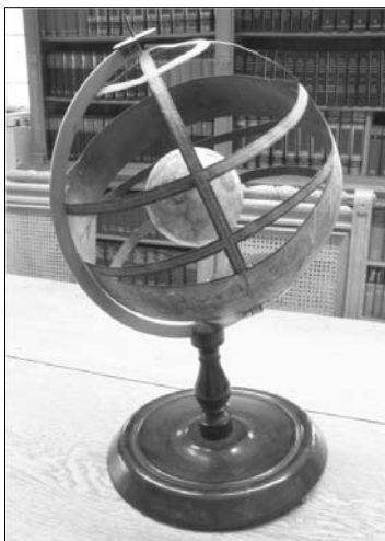
4. ábra A földgömb az armilláris szférában