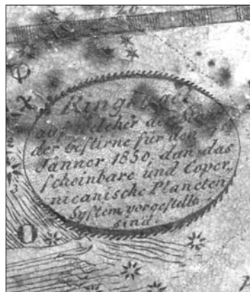
5. ábra „Gyűrűs gömb az égitestek 1850. január 1-jei állásával...”