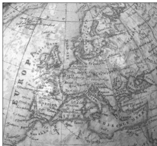
11. ábra Ferrótól a Fekete-tengerig

kollégáim által lefényképezett gömbről. Azonban Ambrus-Fallenbüchl cikke erről nem, csupán az 1931-es 12 cm-es glóbuszról szól!