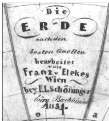
2. ábra A 12 cm-es glóbusz felirata