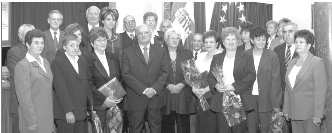
Kitüntettek: Gráf József földművelésügyi és vidékfejlesztési miniszter társaságában