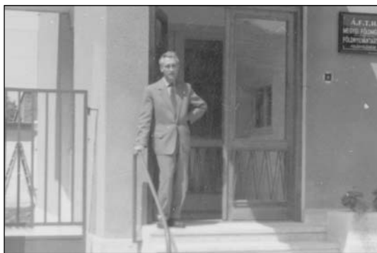
A Szombathelyi Földmérési Felügyelőség új épületének avatása (1961. június 27.)