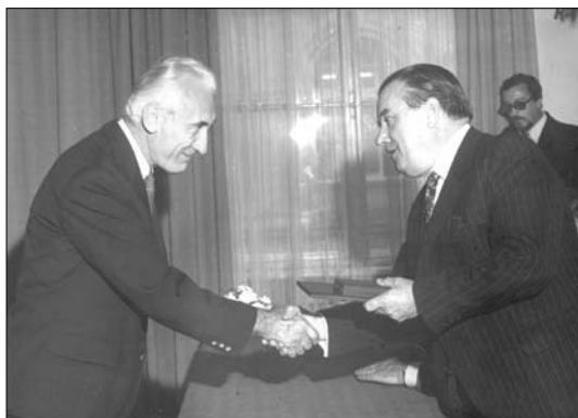
Nyugdíjba vonulási ünnepség (1981 vége)