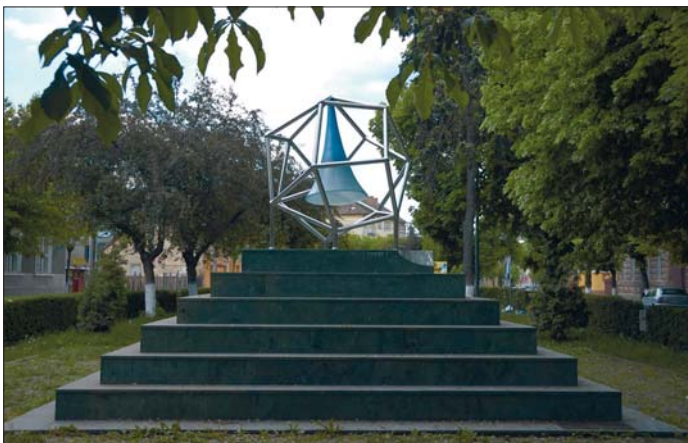
Bolyai János „pszeudoszférája” a Bolyai-téren (Marosvásárhely)