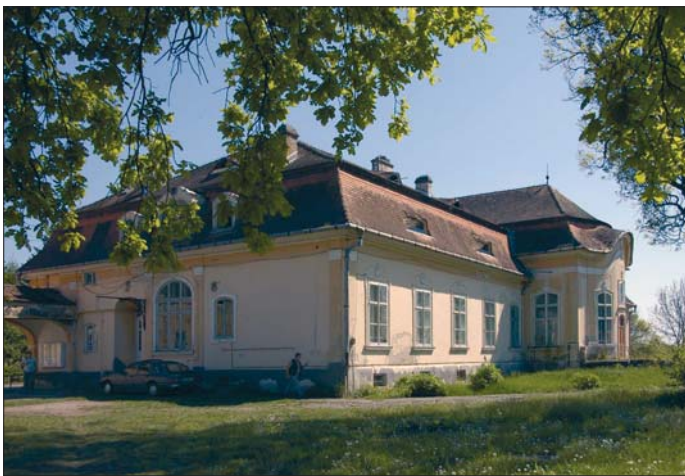
A sárosterki Teleki-kastély, amelyet Teleki Sámuel, a Teleki Téka alapítója építtetett a 18. században (itt lakott az utazó Teleki Sámuel is)