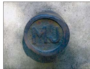
Magassági alappont a szászrégeni templom falában