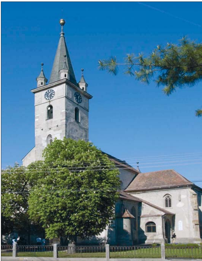
A szászrégeni evangélikus templom