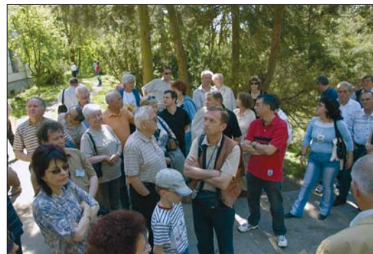
A találkozó résztvevői a gernyeszegi Teleki-kastélynál