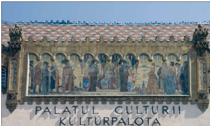
A Kulturpalota mozaik díszítése, amelyet Körösfői-Kriesch Aladár tervei alapján készítették