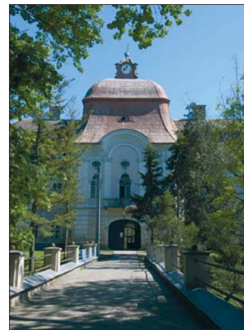
A gernyeszegi Teleki-kastély; az erdélyi barokk legszebb alkotása és a Teleki család ősi fészke (hasonlít a gödöllői kastélyhoz)