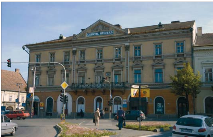
A „Görög-ház” (Marosvásárhely) A segesvári csata előtt itt szállt meg Petőfi