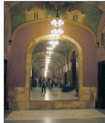
A Kulturpalota előcsarnoka (velencei tükrökkel)