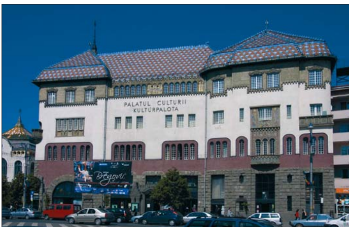
◀ A marosvásárhelyi Kultúrpalota. Épült Bernády György polgármestersége idején; külső és belső díszítésében a gödöllői művésztelép alkotói vettek részt