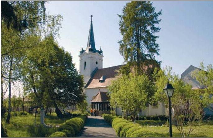
A gernyeszegi református templom. Itt van eltemetve Teleki Mihály, I. Apafi Mihály erdélyi fejedelem kancellárja