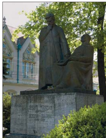
A két Bolyai szobra (Bolyai tér, Marosvásárhely)