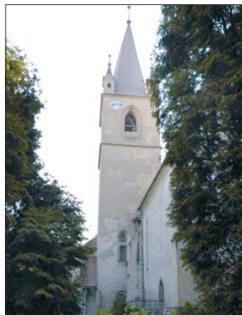
Gótikus stílusú református vártemplom Marosvásárhelyt (38 alkalommal tartottak országgyűlést)