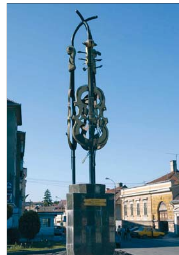
A szászrégeni hegedűgyár emlékére