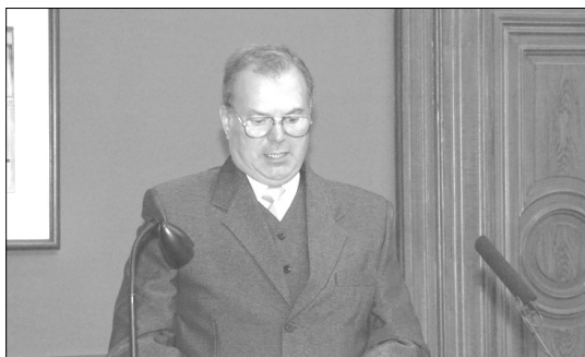
Dr. Ferencz József, az EMT elnöke

A Társaságuk fél évszázados tevékenységének utóbbi tizenöt éve számunkra különös jelentőségű: együvé tartozásunk konkrét formákat öltött a Magyar Földmérési, Térképészeti és Távérzékelési Társaság intézményesített együttműködésének keretein belül. Együtműködésünk fő hozadéka az erdélyi magyar földmérők szakmai színvonalának állandó növekedése, amely része az erdélyi magyar tudományosság helyreállításának. Ezt a valóságot értékelte Társaságunk elnöksége, amikor a Magyar Földmérési, Térképészeti és Távérzékelési Társaság az erdélyi magyar tudománysszervezés érdekében kifejtett tevékenységét