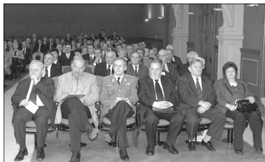
Az emlékülésre megtelt az Akadémia nagyterme

A megemlékezésen minden szakterület képviselői részt vettek. Jelen voltak szakterületünk akadémikusai, a földügyért felelős vezetők, a katonai térképészet vezető munkatársai, intézményi vezetők és dolgozók (földhivatalok, FÖMI stb.), vállalkozások vezetői és munkatársai.