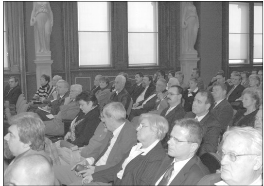
A hallgatóság nagy érdeklődéssel figyelte a köszöntőket

Az ülés résztvevői megnyugvással hallgatták szakállamtikár úr szavait, melyekből kicsengett, hogy a felső vezetés a jövőben is számít a Társaság szakmai munkájára, a szakmai társadalmat mozgató és összetartó erejére.