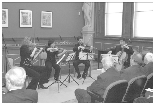
Az Akadémia vonósnégyese

A köszöntéseket az Akadémia vonósnégyesének „mini” hangversenye zárta.