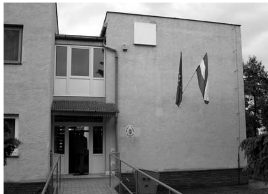
A kirendeltség bejárata

Az avató ünnepély hivatalos programját Bolla Gyula