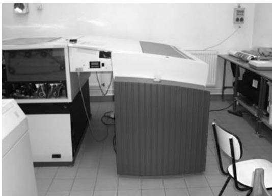
B/I-es Heidelberg levilágító

Október 7-én a Cartographia Kft. vezetője kitazott a Frankfurter Könyvvásárra. Másnap kapta az Üzemi Tanács elnökének az értesítését arról, hogy a Forrás Rt. nyilvános, egyfordulós pályázat