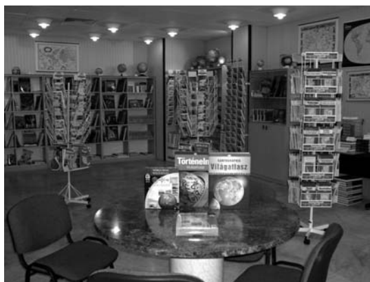
Térképbolt a Bosnyák téren