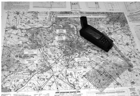
A Magyar Honvédség új 1:250 000 JOG Air térképeinek oktatótérkép változata

zékkelhető kétségtelen fölénye miatt – az akkori formában szükségtelenné és gazdaságtalanná vált. A még működő Asztrogeodéziai Állomás 1990-ben nemcsak hazai viszonylatban, de még a volt szocialista országok körében is elsőként szerzett be kétfrekvenciás nagy pontosságú GPS vevőberendezéseket. Később ezekkel az eszközökkel kezdtük meg a katonai GPS hálózat kialakítását, amelyet később az USA Védelmi Térképészeti Hivatalával együttműködve bővítettünk, és az ő közreműködésükkel végzett abszolút meghatározások segítségével csatlakoztunk a WGS 84 rendszer-