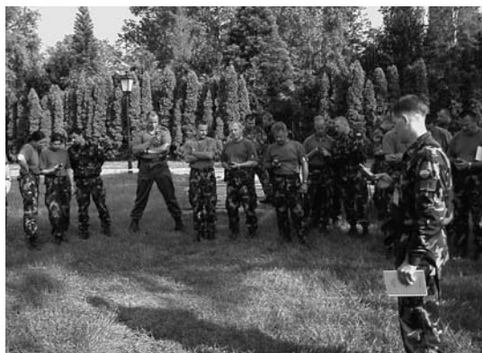
Az MH Térképész Szolgálat szakembere kiképzést tart a kézi GPS vevő használatáról

A Kht.-t említve feltétlenül szólnom kell arról a már jóval korábban megkezdett, és az utóbbi három évben véghezvitt fejlesztői tevékenységről,