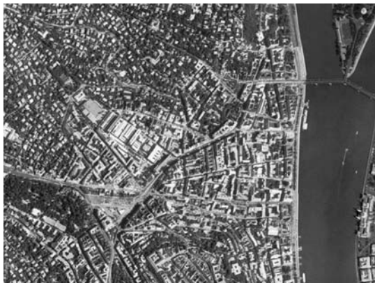
Budai ortofotó részlet az MH Térképész Szolgálat és a HM Térképészeti Kht. székhelyével

nyek kielégítésére. A Magyar Honvédség a DITAB-MIL (a DITAB katonai változata, ami a 1:25 000–1:250 000 méretarányú topográfiai térképek alapja lesz, 1:25 000-es topográfiai térkép-