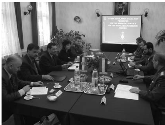
Horvát delegáció látogatása az MH Térképész Szolgálatnál

si fejlesztési folyamatokban partnerként tudjon közreműködni, továbbá meg tudja ítélni, hogy a fejlesztési folyamat végére milyen eredmény jött létre, és a kitűzött célok megvalósultak-e. Ez fon-