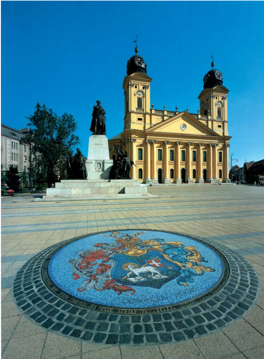
Fő tér: háttérben a Kossuth szobor és a Nagytemplom