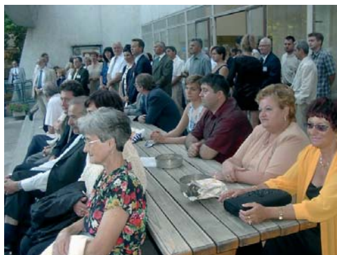
... és közönsége