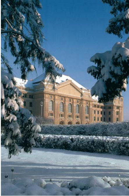
A Debreceni Egyetem központi épülete