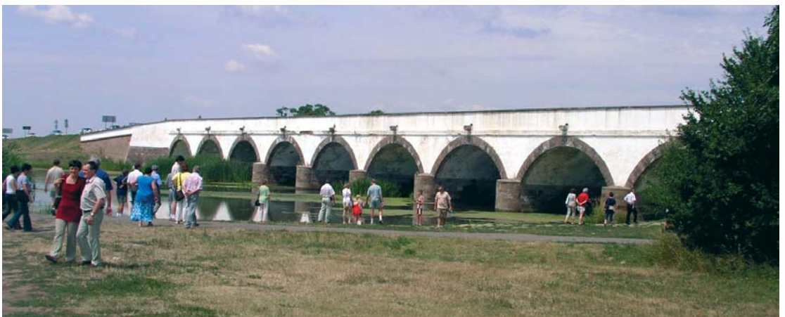
A kilenc „likű” híd