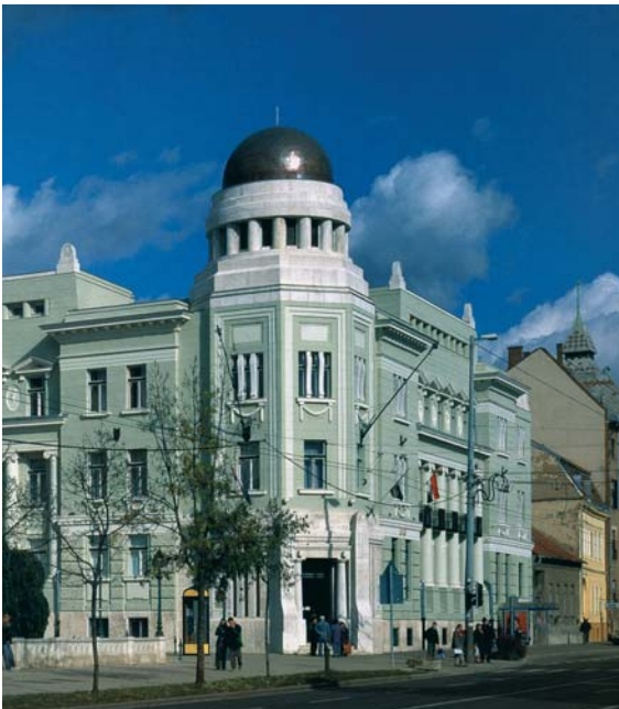
A Hajdú-Bihar Megyei Földhivatal épülete