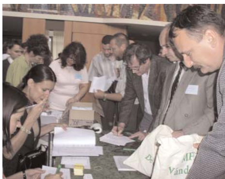
Regisztráció az első napon