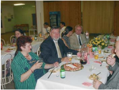
A vacsora prominens résztvevői