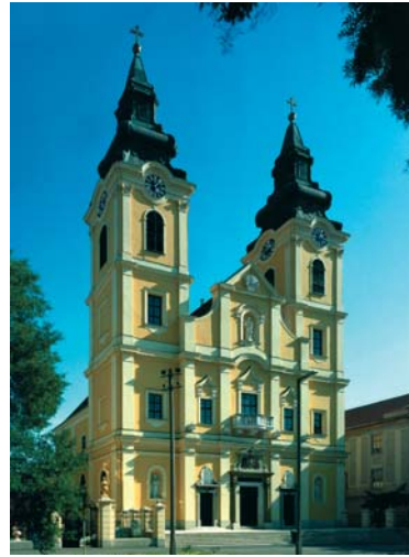
Szent Anna templom