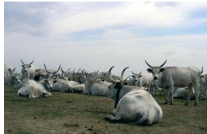
Szilaj csorda (szürke marhák)