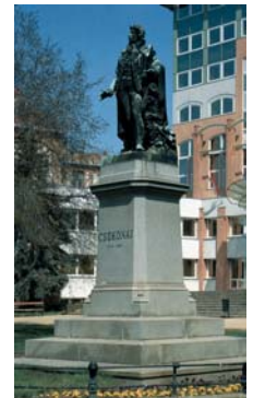
Köztéri szobrok; feliül Bocskai István, alul pedig Csokonai Vitéz Mihály