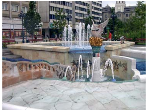
Díszkút Debrecen főterén