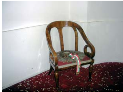
Kossuth Lajos széke a Nagytemplomban