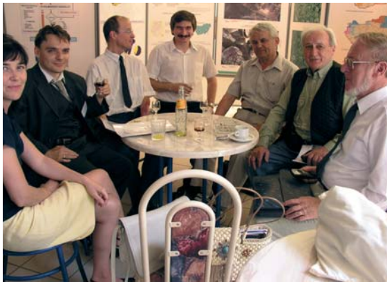
Egy kiállítás képei – FÖMI közreműködőkkel