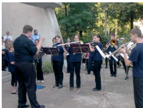
A „kedvcsináló” zenekar