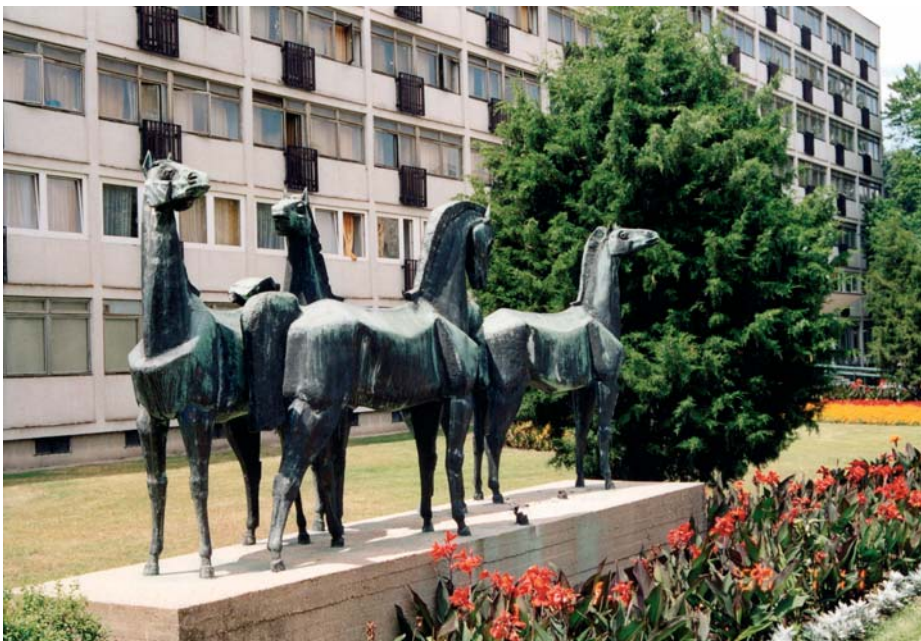
Lovak az Agrár-centrum udvarán