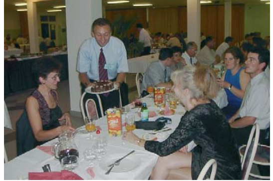
Önkéntes szerepváltás: az erősebb „nem” szervíroz