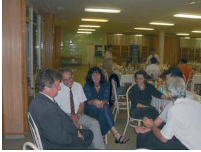
Baráti beszélgetés