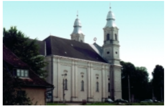
A csíksomlyói kegytemplom