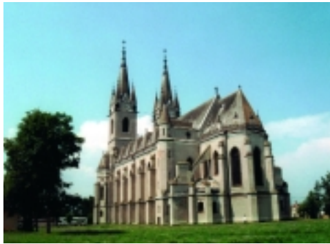
A dítrói Nagytemplom