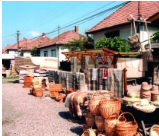
Visszatéréskor a maradék forintok elköltésének színhelye