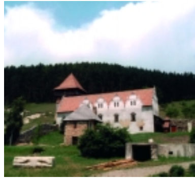
Szárhegy, Lázár István főkirálybíró reneszánsz kastélya 1631-ből