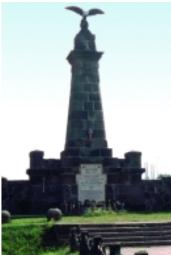
A „mádéfalvi veszedelem“ emlékműve