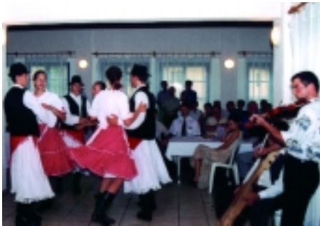
A muzsikaszó mindenkit jókedvre derít