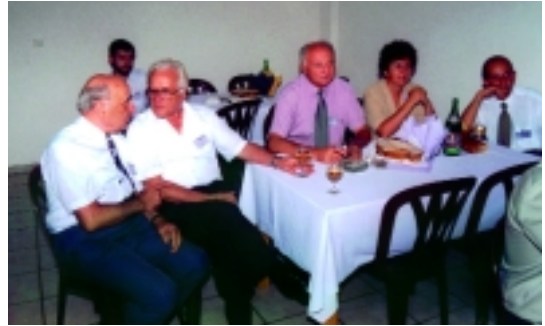
Részlet a baráti vacsoráról