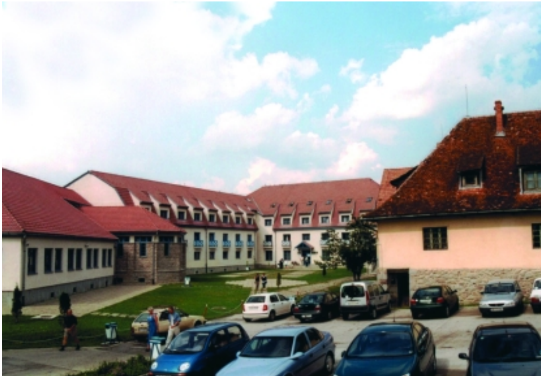
A csíksomlyói Jakab Antal Tanulmányi Ház (a tanácskozás helyszíne)