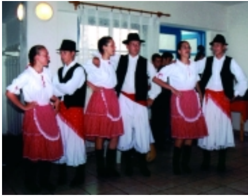
Egy kis erdélyi tánc...