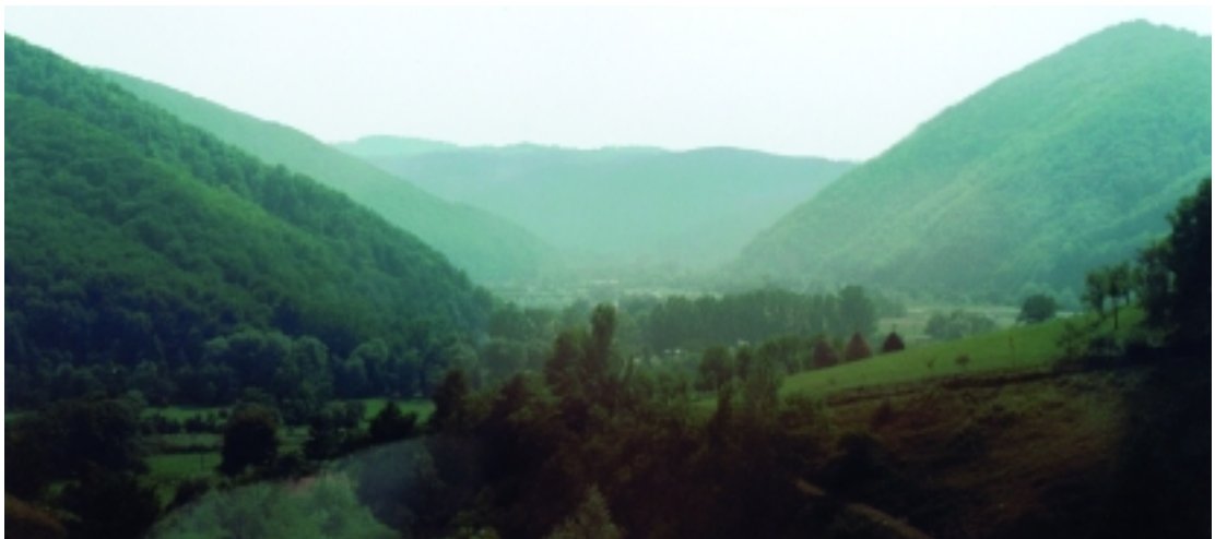
Búcsúzás Erdélytől (Király-hágó)