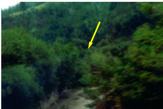
A sárga nyíl a történelmi határt mutatja