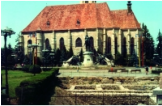
A kolozsvári Mátyás-templom és a Funar-féle „ásatások“