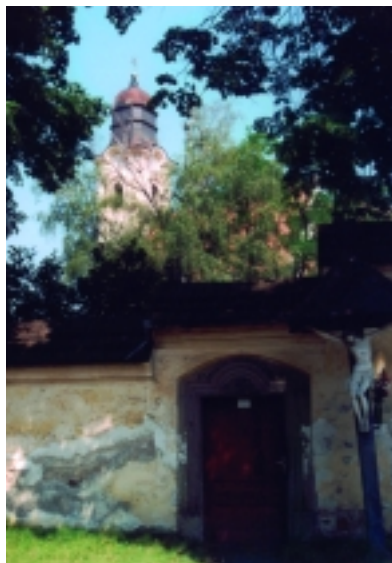
Örmény katolikus templom 1748-ból Gyergyószentmiklóson és a templomkert részletei