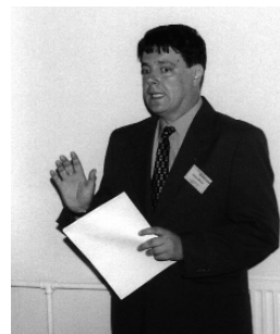
A tanácskozás további pillanatképei