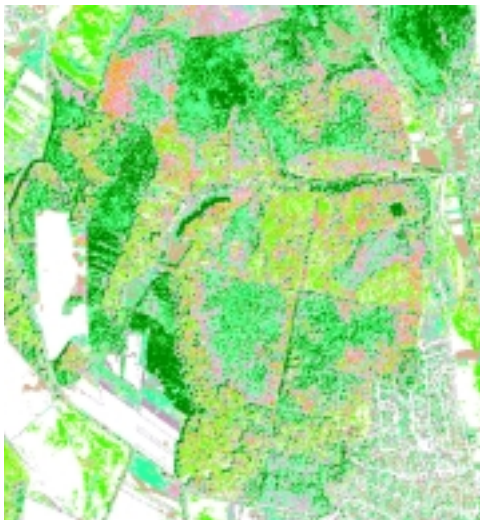
(lent) 10. kép Ugyanazon terület pixel alapú (balra) –, illetve szegmentáció utáni (jobbra) ISODATA osztályozásának végeredménye. (A hasonló színek hasonló osztályokat jelölnek.)