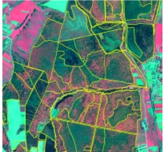
(balra fent) 8. kép Első terepi adatgyűjtés területei (Zirc környéke)