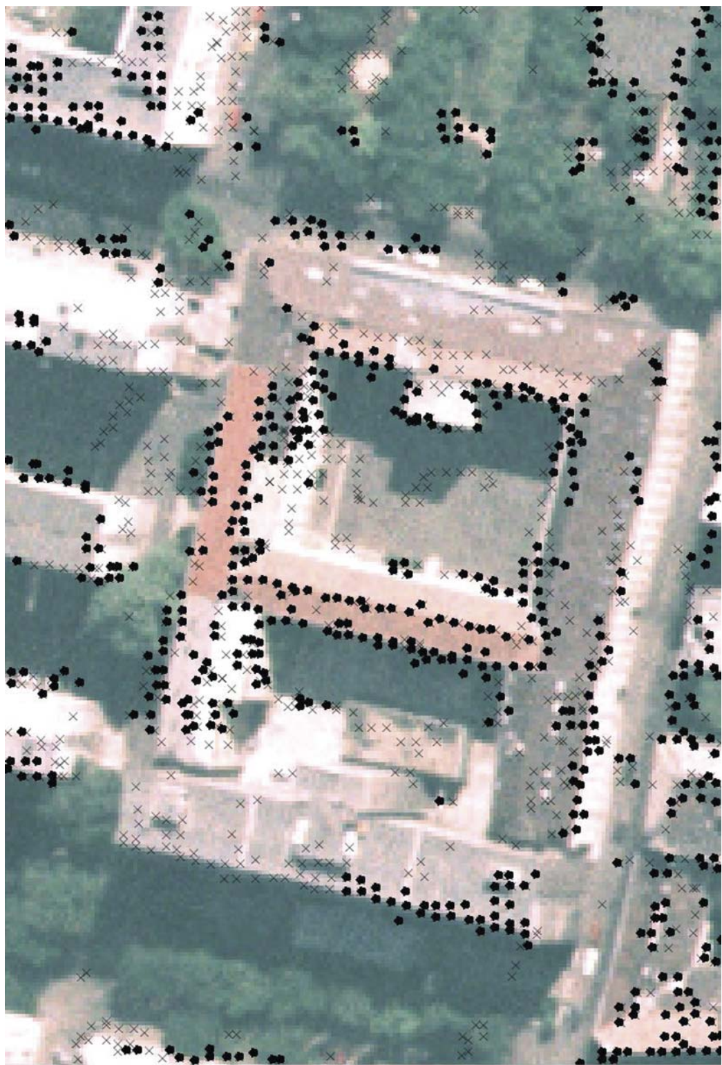
Automatikus fotogrammetrikus eljárással, különböző paraméterekkel kinyert magassági pontok elhelyezkedése városi környezetben (Kapcsolódó cikket lásd a 12–17. oldalon.)