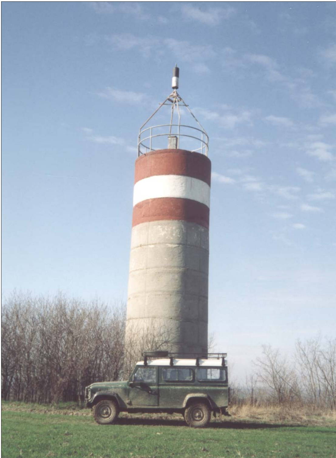
A felsőrendű vízszintes alaphálózatban létesített vasbeton mérőtorony