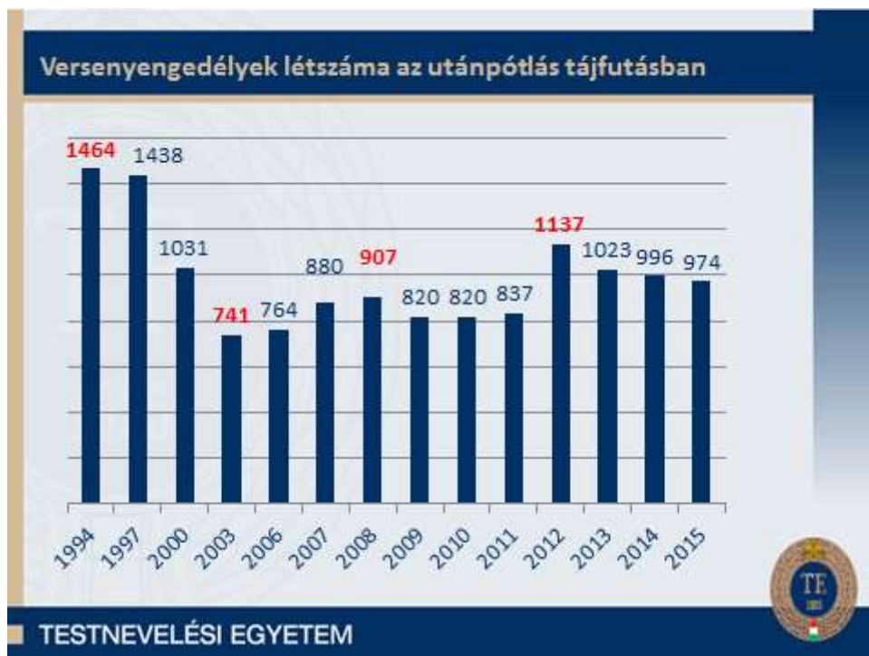
2. ábra: Az oszlopok felett a szám az utánpótlás korosztály versenyedélyeinek száma, alatta az évszám látható.