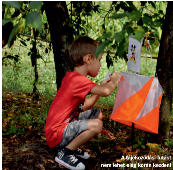
A tájékozdási futást nem lehet elég korán kezdeni

Az egyesület nélkül közöltek mindannyian a Salg. Dornay versenyzői. Cz. Z. J.