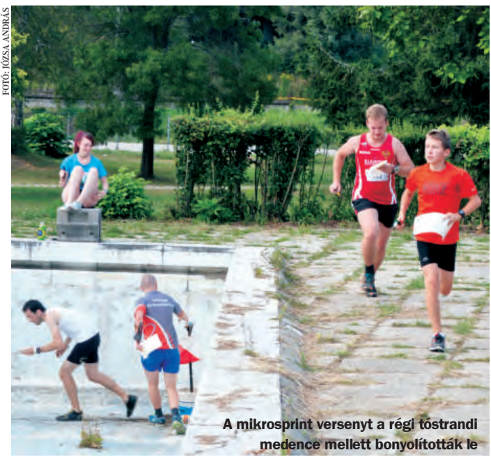
A mikrosprint versenyt a régi tóstrandi medence mellett bonyolították le