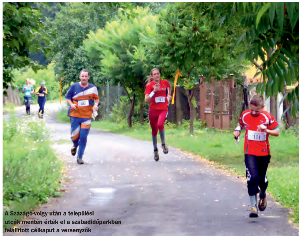
A Százágú-völgy után a települési utcák mentén érték el a szabadidőparkban felállított célkaput a versenyzők