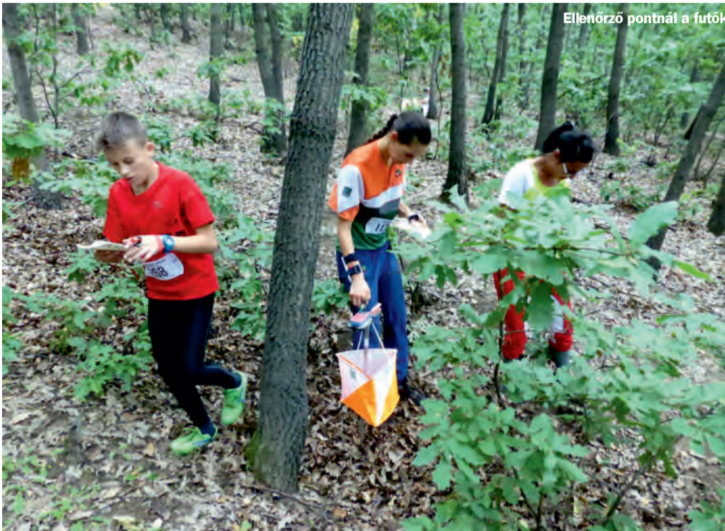
Ellenőrző pontnál a futók