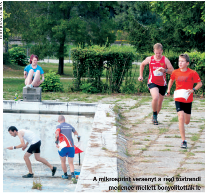
A mikrosprint versenyt a régi tóstrand medence mellett bonyolították le