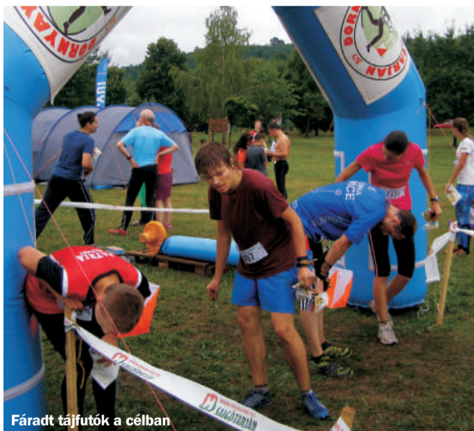
Fáradt tájfutók a célban

délelőttjén a középtávú verseny következik, a pályákat Rónafalu és Szilvás-kő környékén jelölték ki. Rendkívül részletgazdag domborzat várja a résztvevőket, az egykori bányászati nyomaival, bizarr sziklaalakzatokkal, igazi tájfutó csemege. Az SBTC-pálya környékén, 16 órától egy nosztalgia versenyt is rendeznek majd, Retr-O 40 elnevezéssel, annak emlékére, hogy ezt megelőzően 40 éve, 1975-ben adott otthont Salgótarján a Hungária Kupának. A szervezők mindent a '70-es éveknek megfelelően állítottak össze.