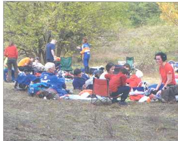
Sport és családi program

A térképnek abban kell segítenie a rendezőket és versenyzőket, hogy megtudják hová lehet elhelyezni, illetve hol található az ellenőrző pontok. Ábrázolja a jellegzetes fákat és sziklákat, a forrásokat, a vadgazdálkodási létesítményeket (pl.: magasles), a talajszelvény gödröket, dagonyákat stb. Megmutatja azokat a domborzati képződményeket, tereptárgyakat, amelyeket a versenyző haladás közben felismer. Tájékoztat a domborzat kitérségéről, lejtési viszonyairól, a talajfelszín állapotáról. A haladás gyorsaságát befolyásoló növényzetről szí-