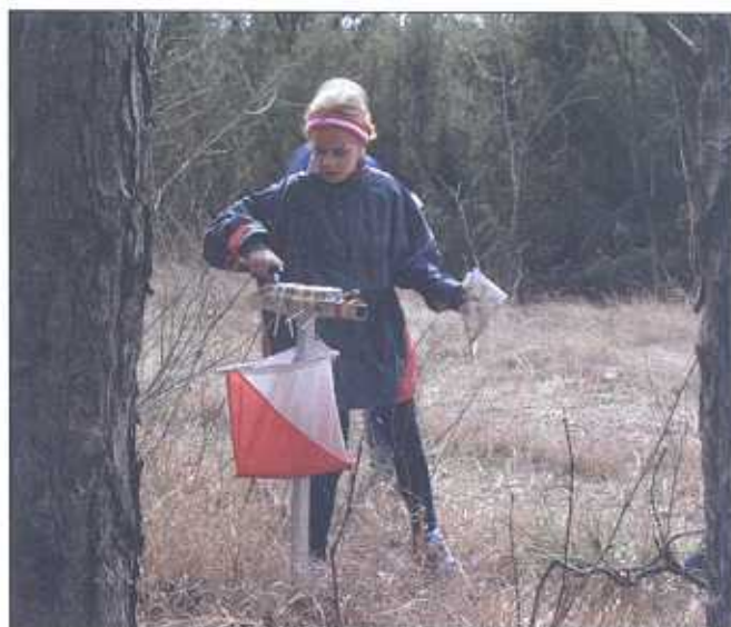
Igazolás a tájfutó bójánál

Az egyes korcsoportokon belüli fokozatok pedig – elit, A, B, C – a feladat fizikai és technikai nehézségében különböznek, más-más kihívást jelentve a kezdők és gyakorlottak számára.