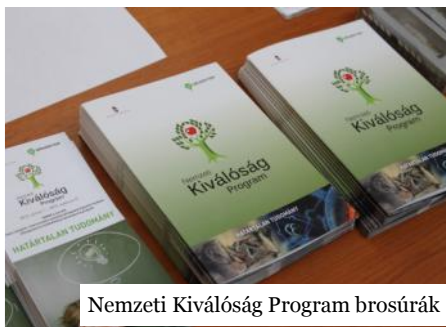
Nemzeti Kiválóság Program brosrúrák