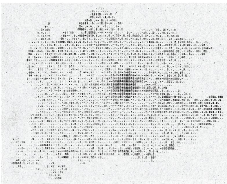
2. ábra. Megyei tervezést szolgáló kartogram kísérleti változata (1972)

goztak ki olyan számítógépes módszert, amely a térképrajzolás idejét lerövidítve nyomtatta ki a térképet. Mivel ezek a megyei bontású kartogramok elsősorban a tervezés célját szolgálták, így nem okozott komoly problémát a térképek gyenge megjelenítési minősége, de meg kell jegyezni, hogy ettől függetlenül a módszer nem terjedt el széles körben. A hardverkörnyezetet az ICT 1905 típusú mainframe számítógép biztosította, melyet Kanadában fejlesztettek ki és a hatvanas-hetvenes években főleg az európai piacon volt sikeres vetélytársa a hasonló kategóriájú IBM számítógépeknek. A programozás ALGOL nyelven történt. A legkomolyabb problémát a nyomtatás, a megjelenítés okozta, a korabeli sornyomatók (mátrixnyomatók) nem voltak képesek megfelelő pontosságú nyomtatásra, az alkatrészek kopásával a karakterek egymástól való távolsága is változott. A hibák egy része kiküszöbölhető volt indigó alkalmazásával (az indigós nyomtatás szűrkeségi hatása egyenletesebb volt). Az így készült térképek legfeljebb csak erősen lekicsinyítve voltak olyan minőségűek, hogy akár nyomdai úton is lehetett őket sokszorosítani. (Lackó)