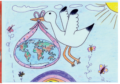
Papp A.: Globalizáció - megérkezett az új generáció! (8 éves, Budapest, 2009)