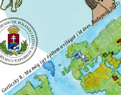
Gerliczky B.: Ma még így építem a világot (14 éves, Budapest, 2013)